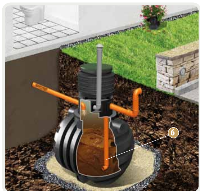
Zainstalowana rura poboru - opcja